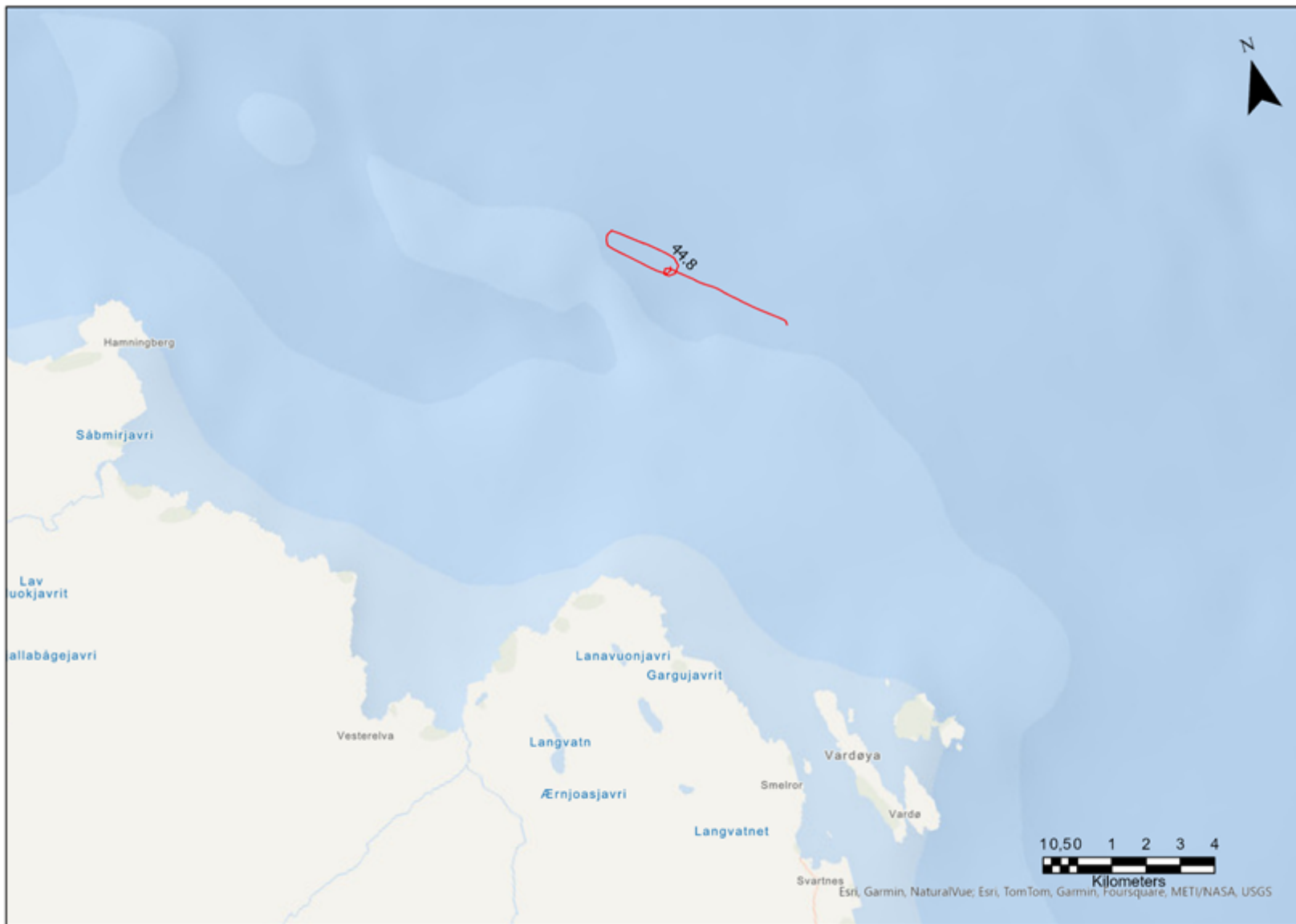
Figur 1. Hal ut av Persfjorden