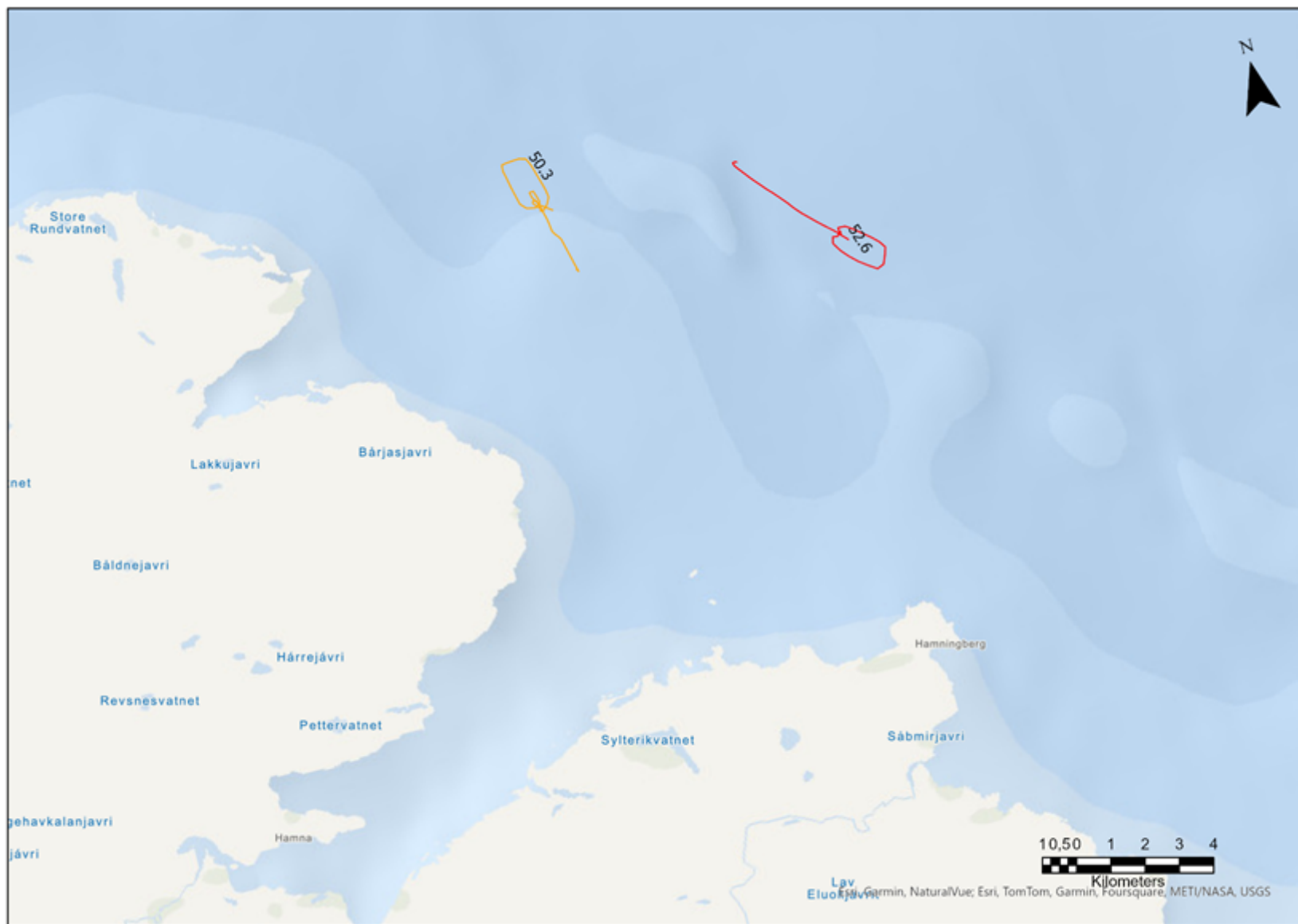
Figur 2. Hal ut av Syltefjorden